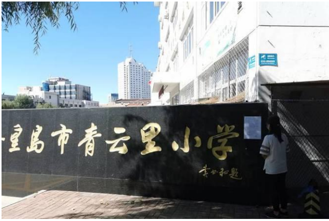
青云里小学（南校区）