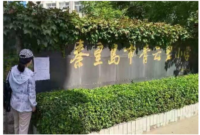
青云里小学（北校区）