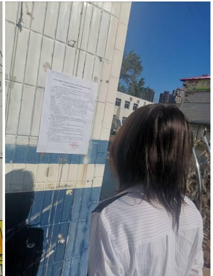
青云里小学（原光明路小学校校区）